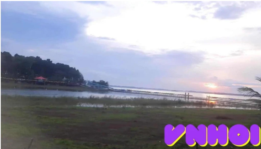
Khu du lich dao o video