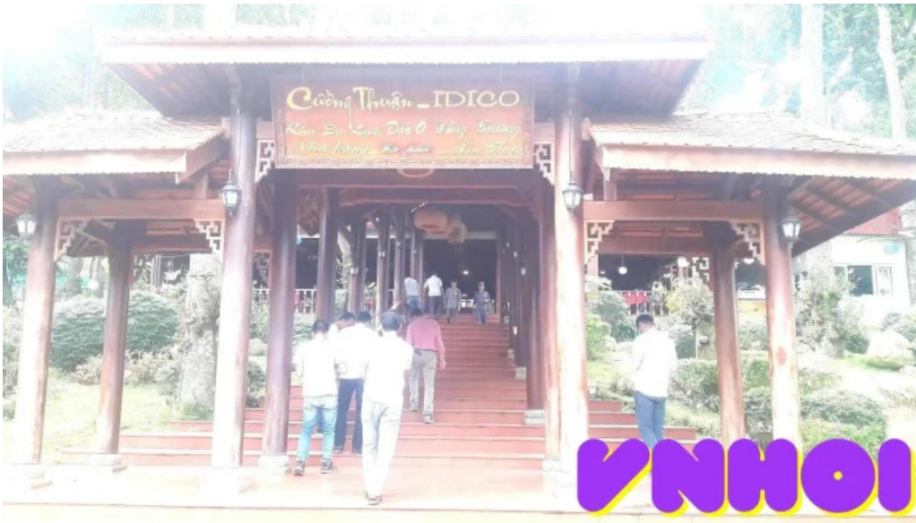
Khu du lịch đạo ở ngoài thạt