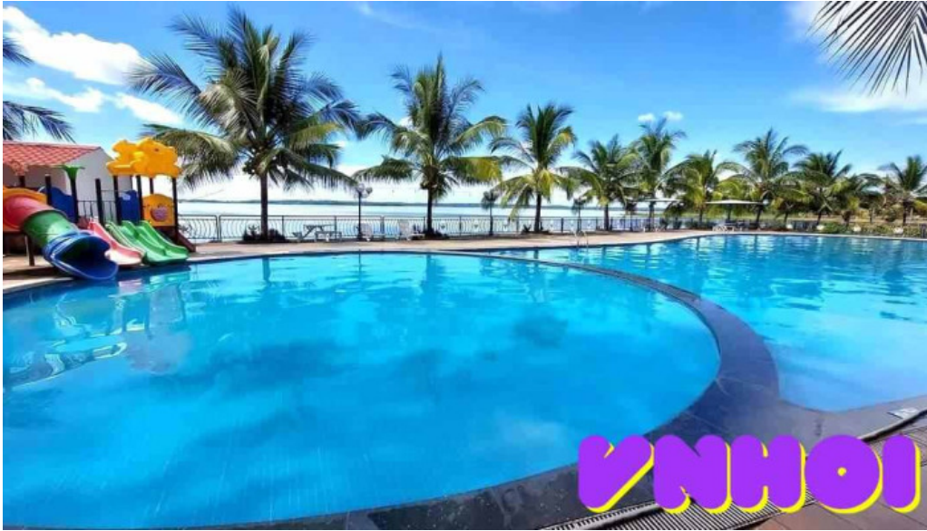
Khu du lịch đảo ở không gian bên trong