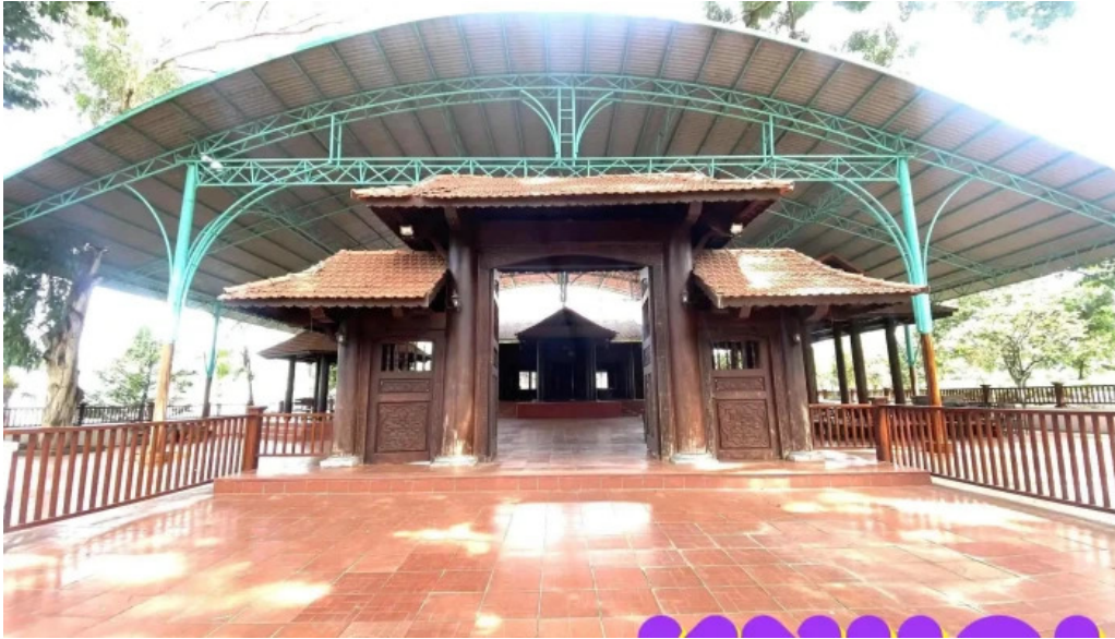
Khu du lịch đạo ở tất cả