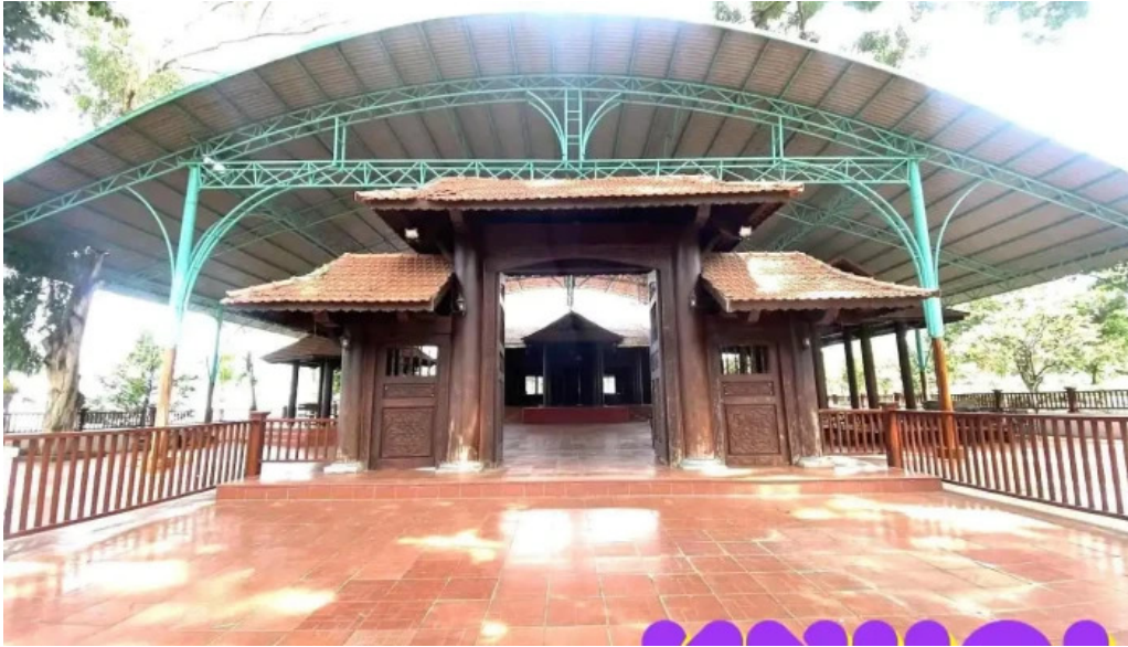
Khu du l?ch ??o o ??ng nai