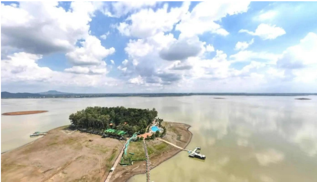
Khu du lịch đảo ở chế độ xem pho và 360deg