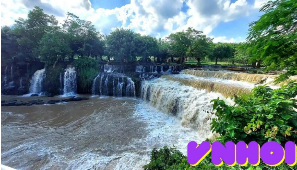
Thác da han tat ca