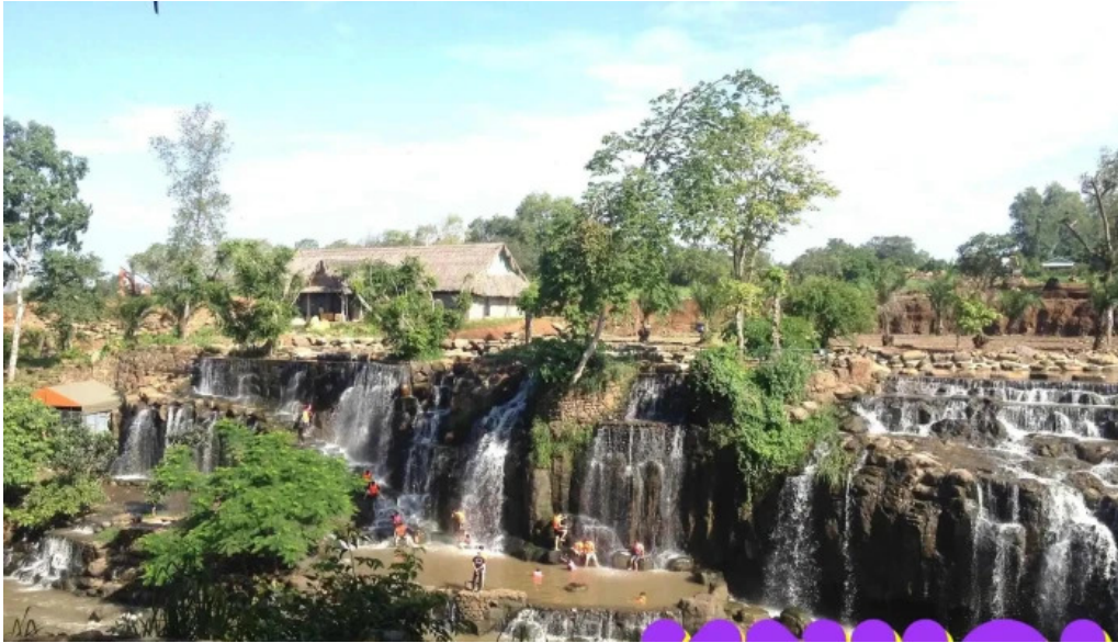
Thac da han cua chu so huu