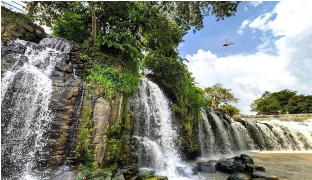
Thac da han che do xem pho va 360deg