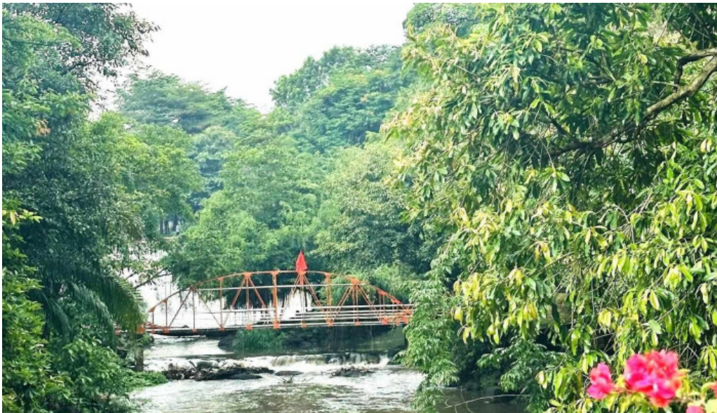
Thác da han moi nhat