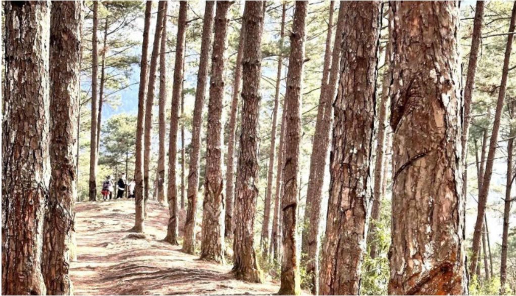
Đôi thông hạn cuon dua tat ca