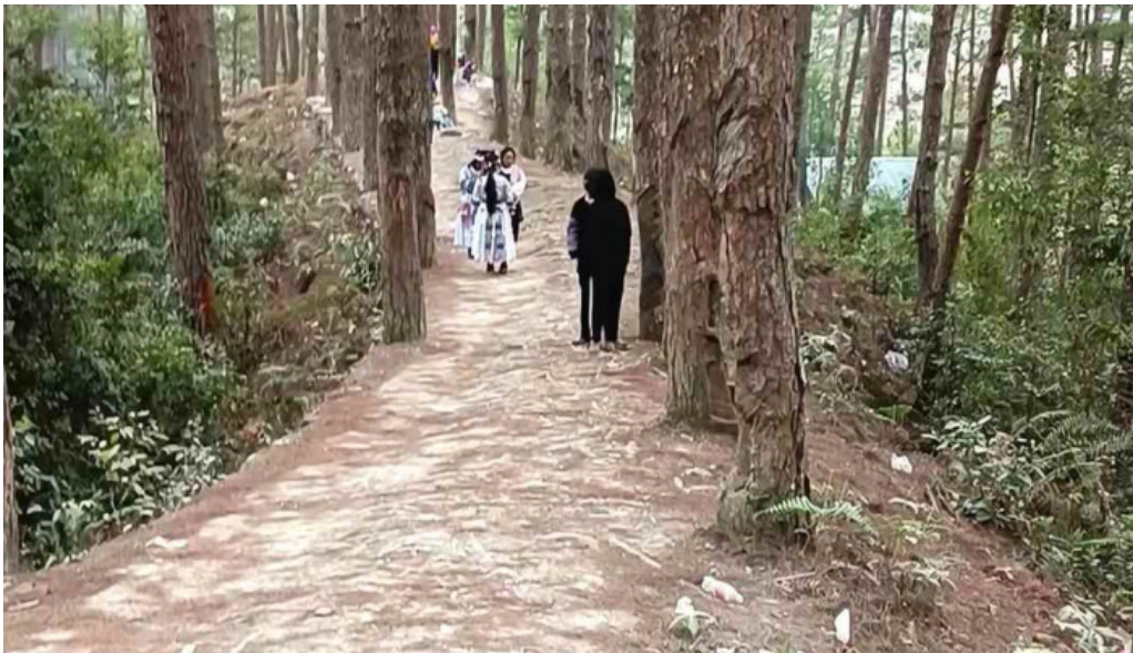
Doi thong han cuon dua video