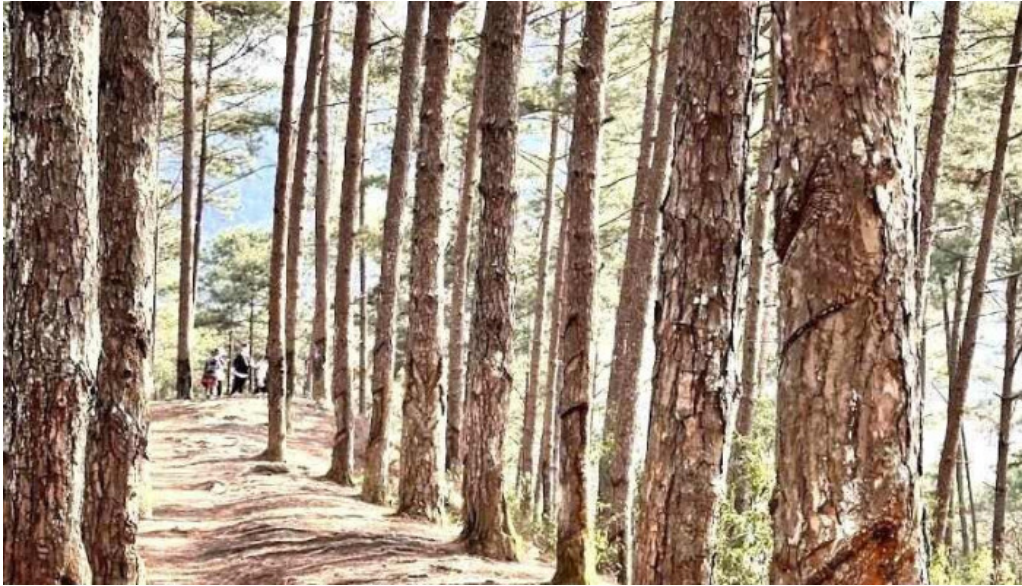
??i thong han cu?n dua yen bai