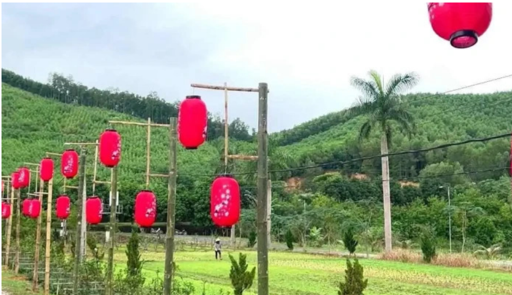
Khu du lich sinh th?i h?n m?t video