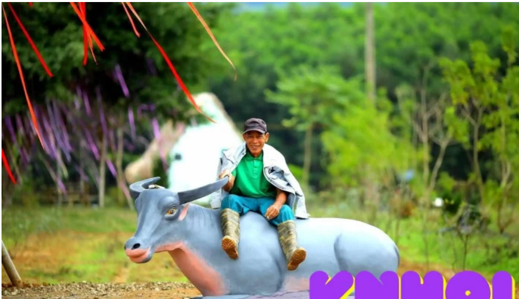
Khu du lịch sinh thái hồ Mat Mối Nhất