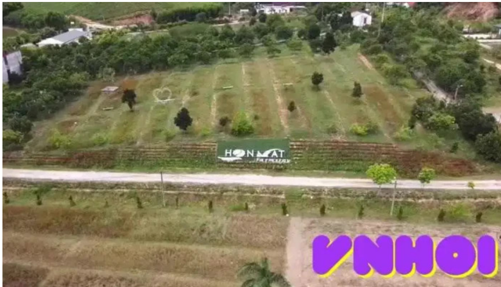
Khu du lịch sinh thái hon mat của chủ sở hữu