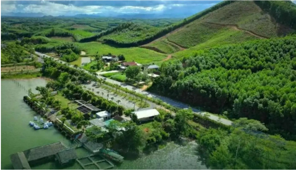
Khu du l?ch sinh th?i h?n m?t ngh? an