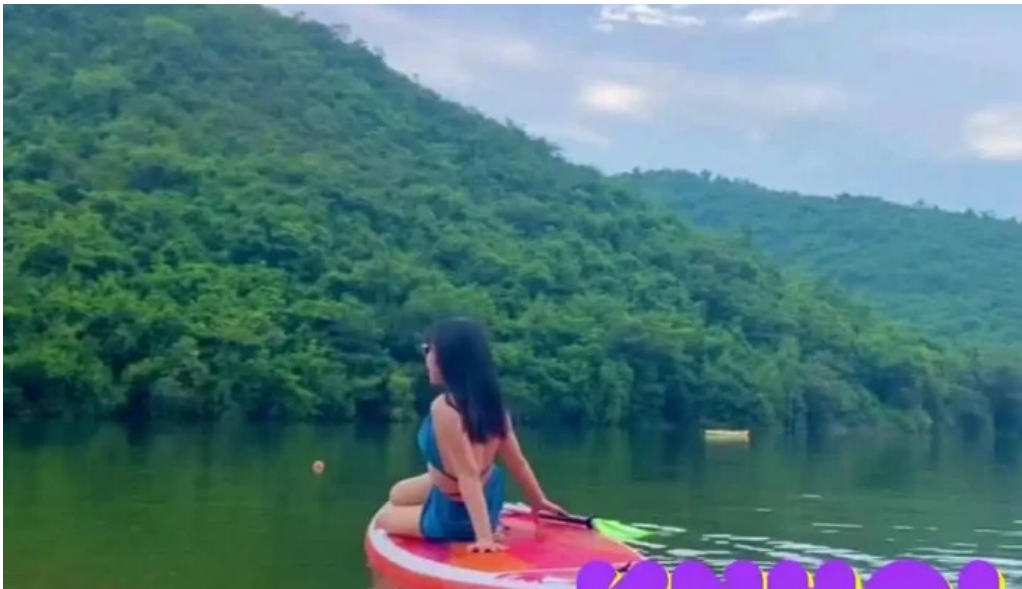
Zcamp nha trang nui