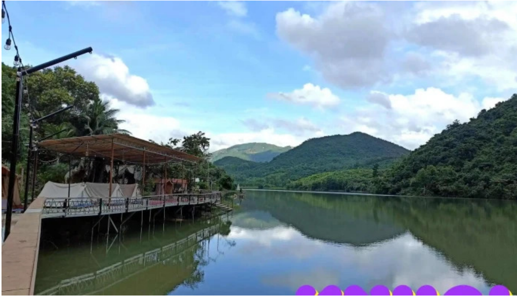
Zcamp nha trang tat ca