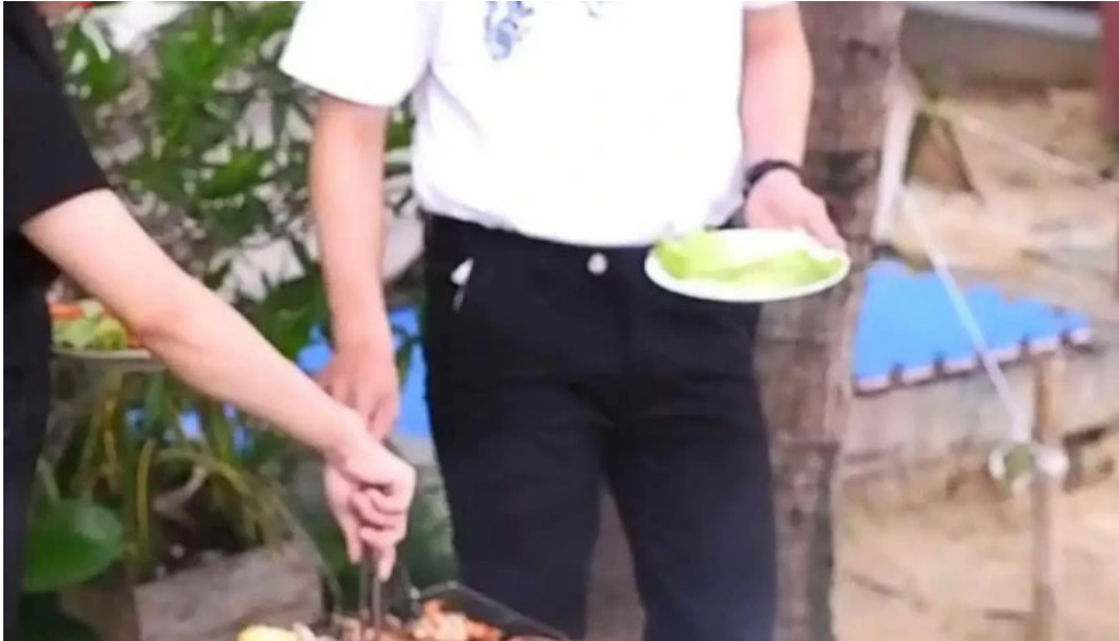
Zcamp nha trang của chu so huu