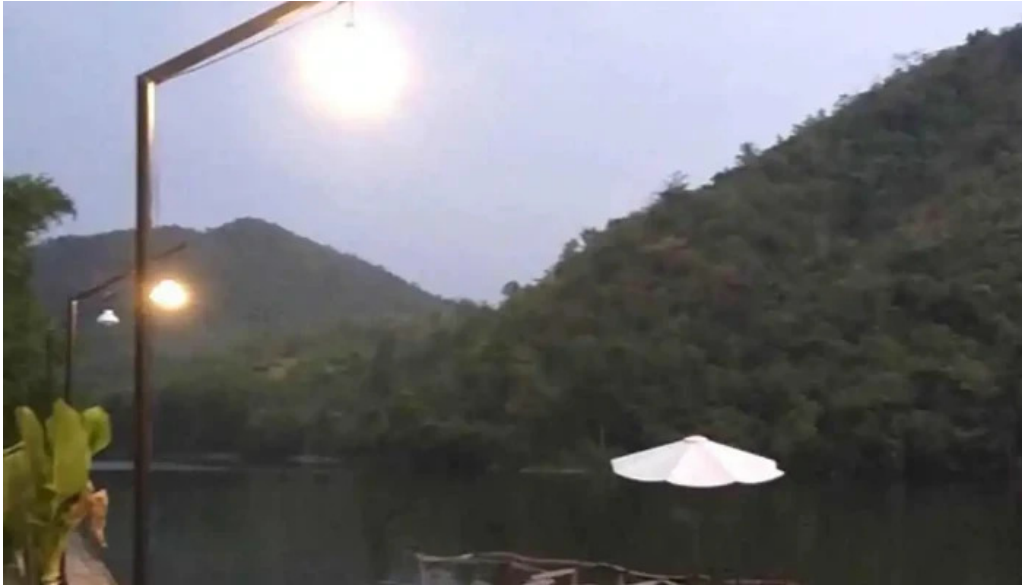
Zcamp nha trang moi nhat