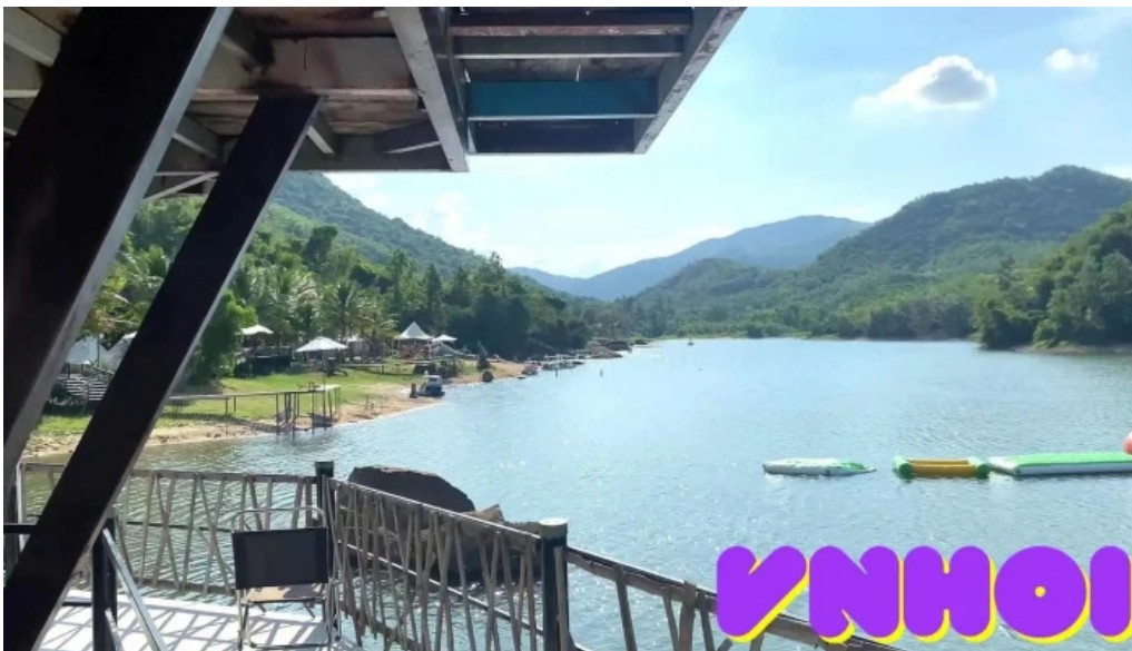
Zcamp nha trang video