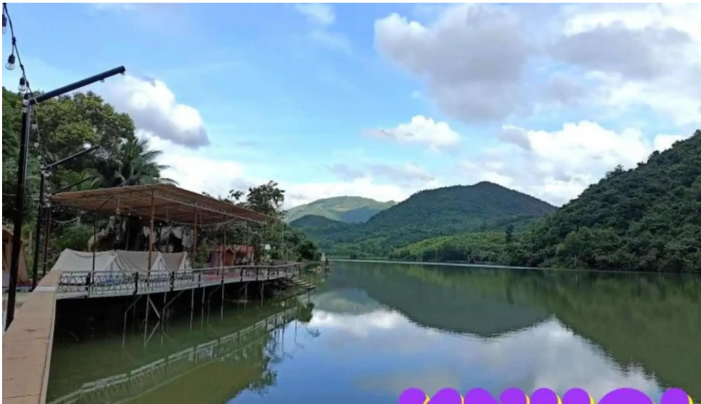
Zcamp nha trang khanh hòa