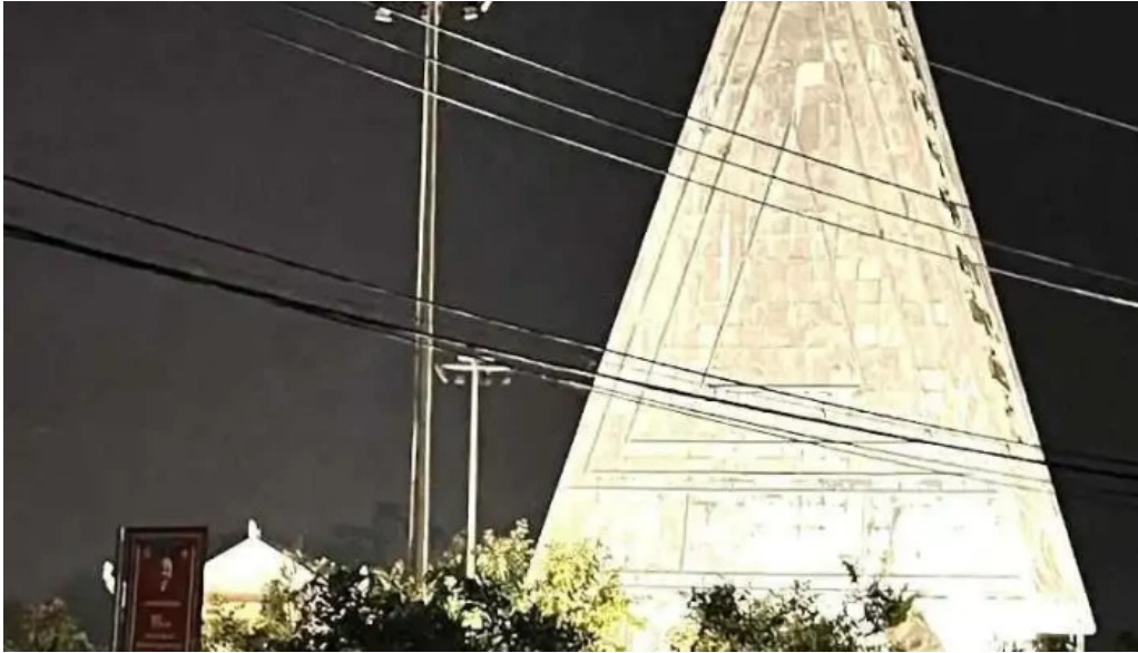
Van tan hotel coffee rooftop kon tum