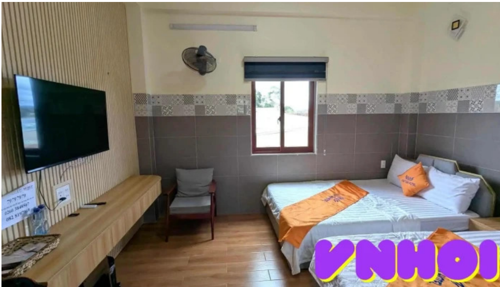
Van tan hotel coffee rooftop phong