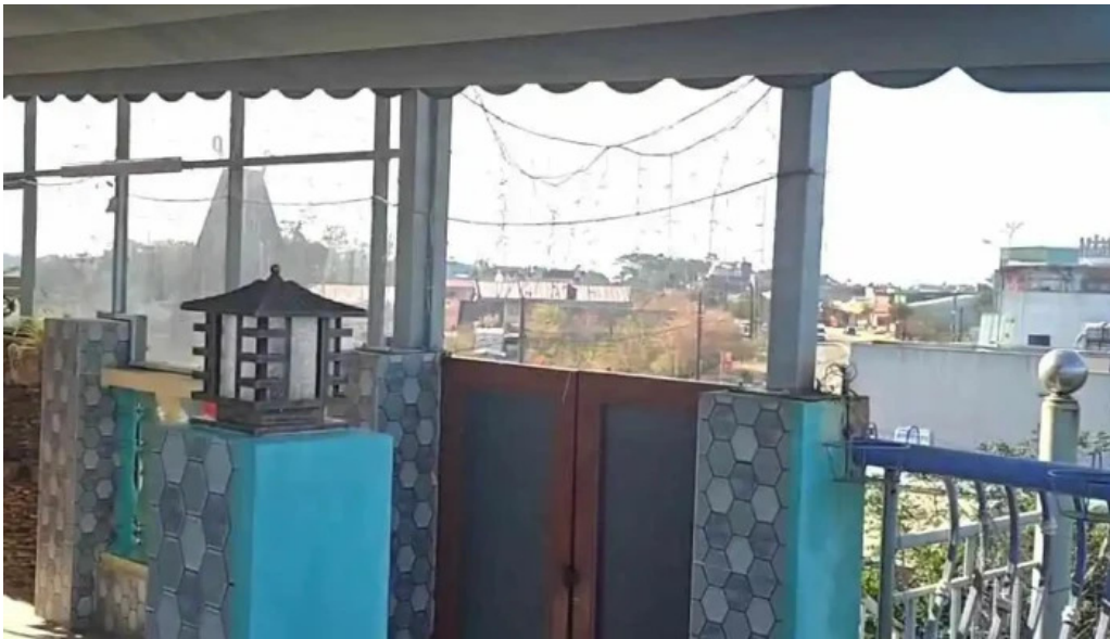
Van tan hotel coffee rooftop cua khach tro