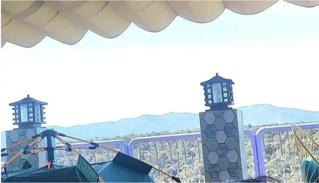
Van tan hotel coffee rooftop video