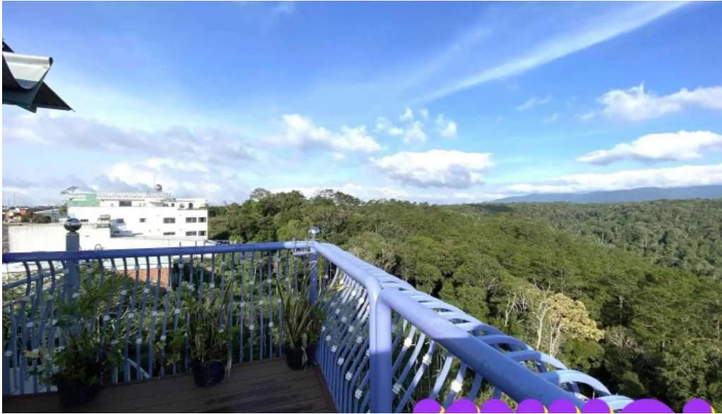
Van tan hotel coffee rooftop ngoai that