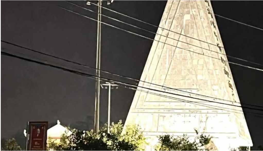
Van tan hotel coffee rooftop tat ca