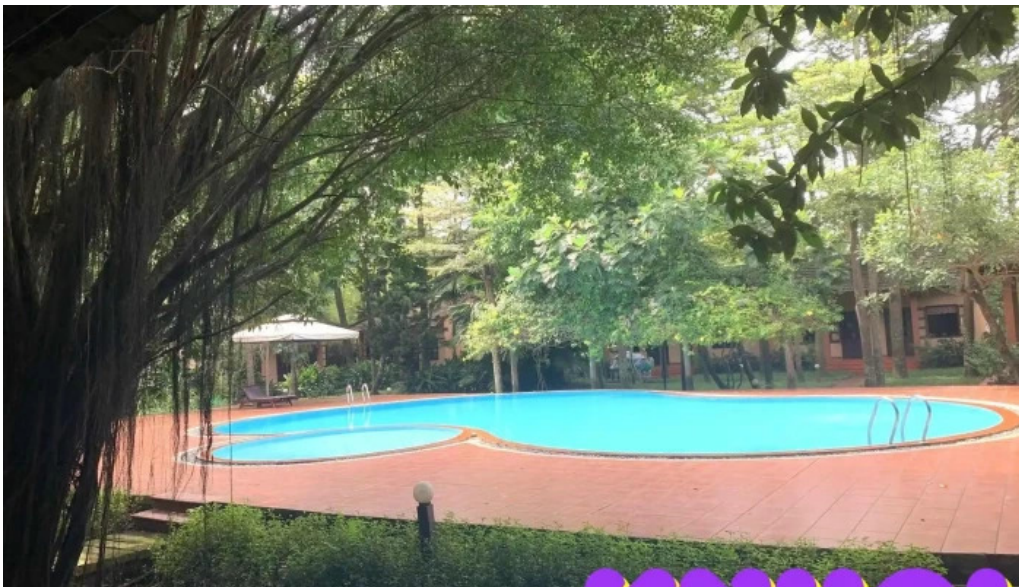
Lotus resort tien nghi