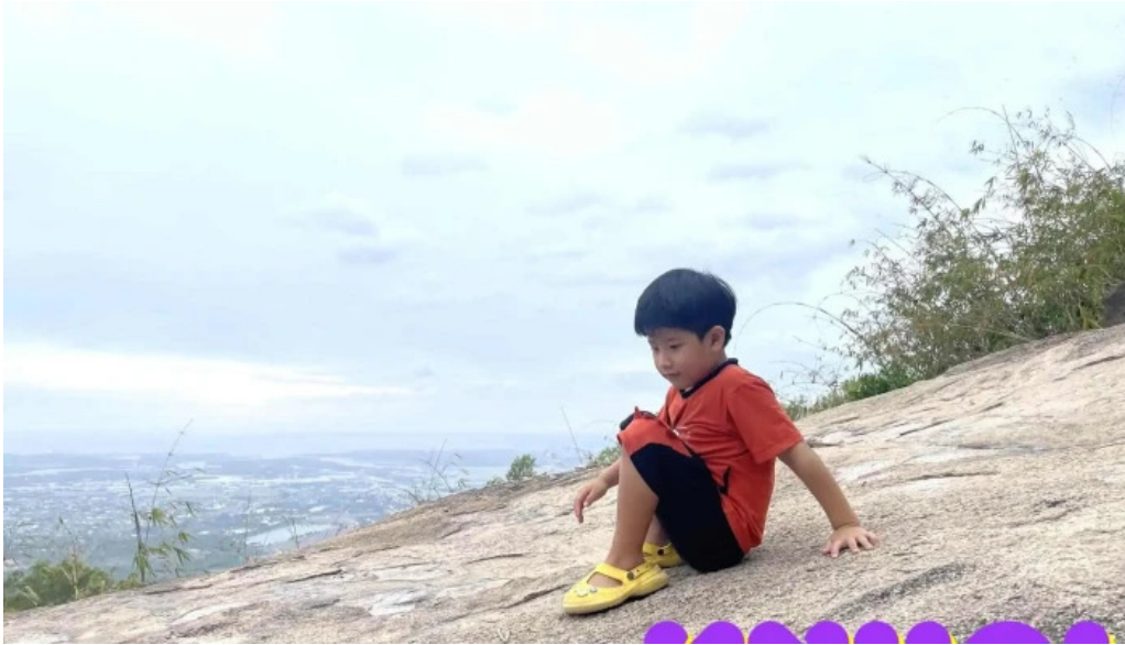
Lotus resort moi nhat