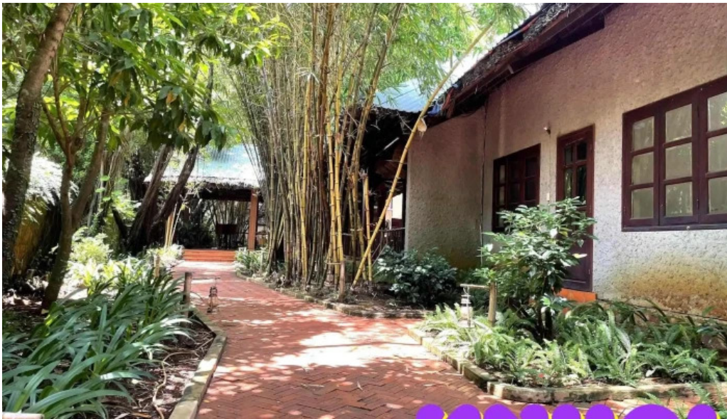
Lotus resort tat ca