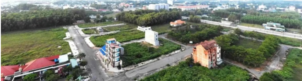
Lotus resort che do xem pho va 360deg