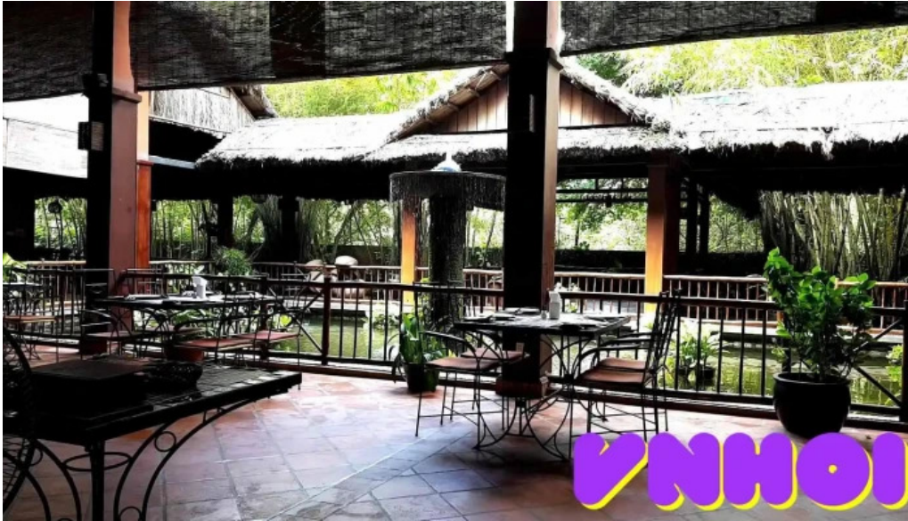
Lotus resort video