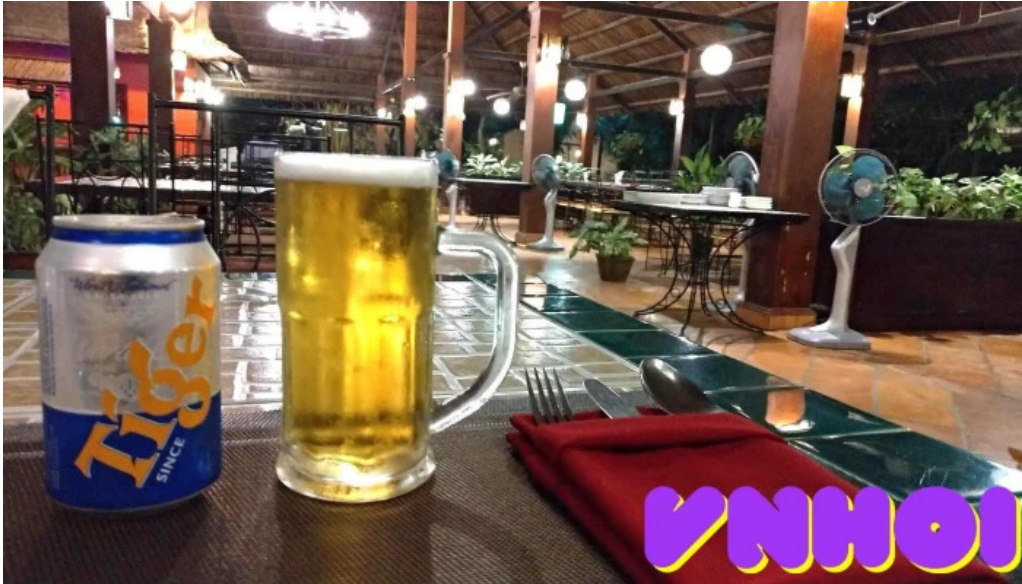
Lotus resort thuc pham va do uong