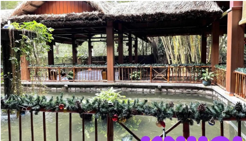
Lotus resort ngoai that