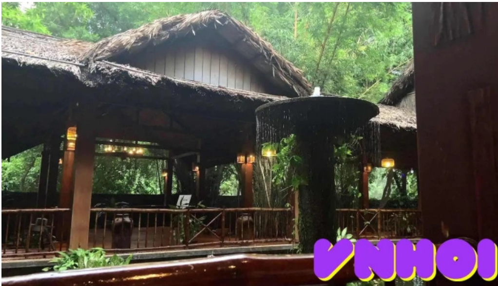
Lotus resort cua khach tro