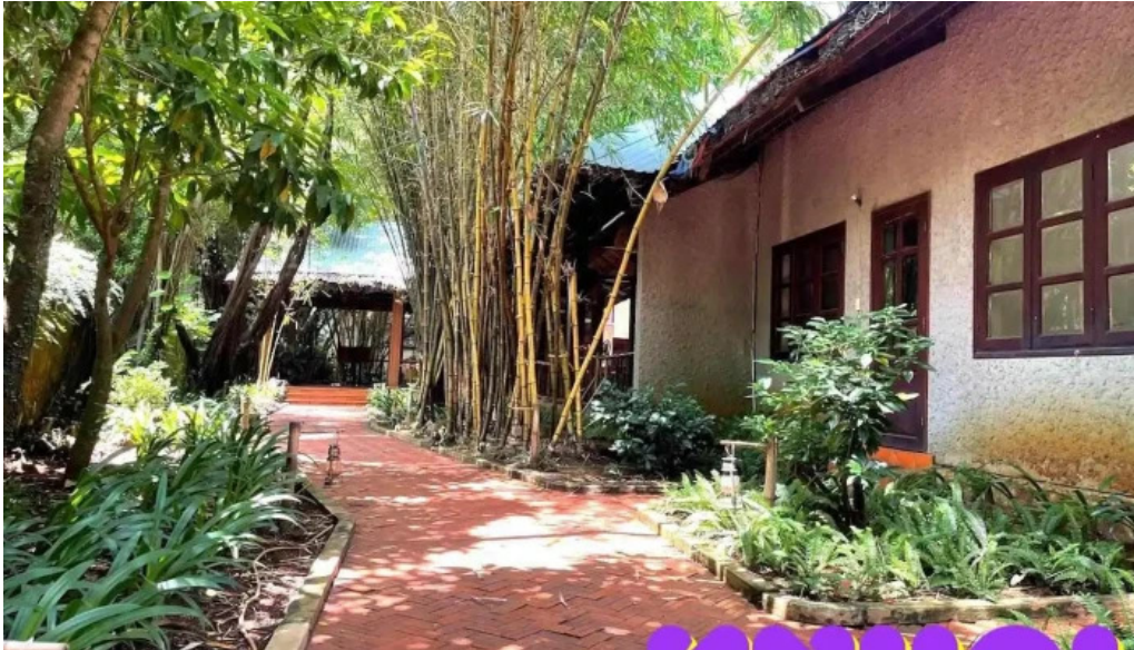
Lotus resort ba r?a v?ng tau